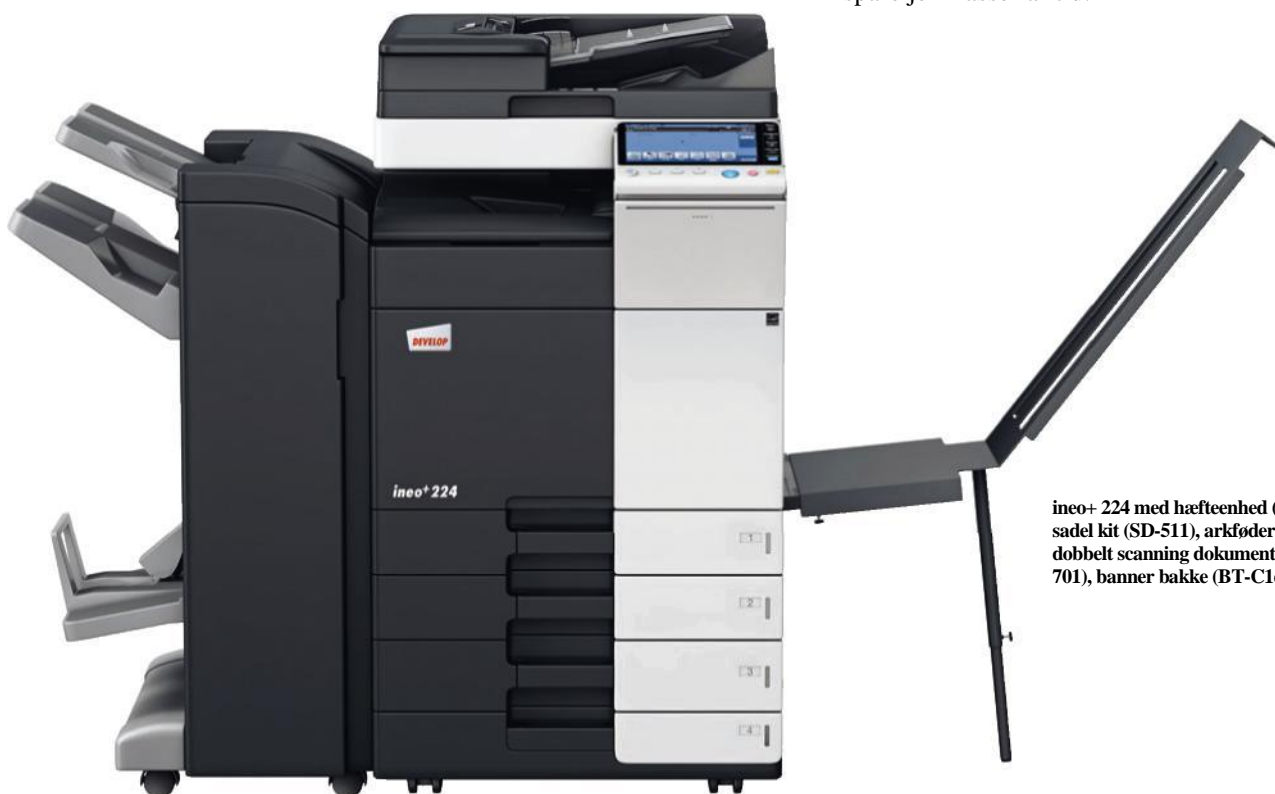
ineo+ 224 med hæfteenhed (FS-534) og sadel kit (SD-511), arkføder (PC-210), dobbelt scanning dokumentfremfører (DF-701), banner bakke (BT-C1e)

Enkelthed går igen i betjeningen af alle funktioner på ineo+224. Et intuitivt, let forståeligt betjeningskoncept sikrer, at det er lige så let at bruge ineo+224, som at bruge en smart-phone eller tablet. Den 9-tommers ”touchscreen” har velkendte funktioner som ”træk & slip”, og takket være en ny menu navigations struktur, kan man se alle funktioner på én gang, og vælg de ønskede indstillinger med blot nogle få klik. Ofte anvendte funktioner kan blive siddende på start-skærmen, og dem, du ikke bruger simpelthen fjernet. Det er den slags tilpasning, der vil spare jer masser af tid.