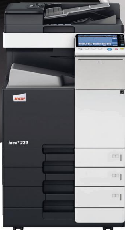
ineo+ 224 med arkføder (PC-110) og dobbelt scan dokumentføder (DF-701)